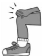
Palmas en las piernas

a) Observa los siguientes dibujos que simbolizan percusiones corporales. Encierra en un círculo o pinta aquellos que hayas utilizado en el ejercicio anterior: