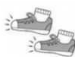
Pisotón - Zapateo