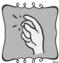
Chasquido de dedos