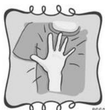
Golpe en el pecho