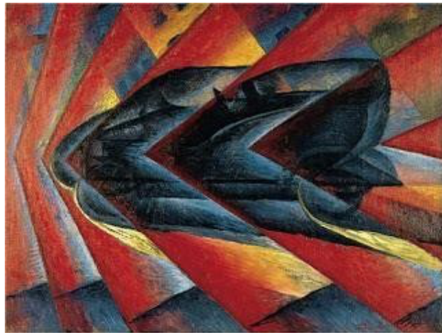
RUSSOLO: "Dinamismo de un automóvil", 1913

El Futurismo es un movimiento literario y artístico que surge en Italia en el primer decenio del S. XX mientras el Cubismo aparece en Francia. Gira en torno a la figura de Marinetti, quien publica en el periódico parisiense Le Figaro el 20 de Febrero de 1909 el Manifiesto Futurista. Características del Futurismo. El Futurismo fue una vanguardia que buscaba reflejar el movimiento, el dinamismo, la velocidad, la fuerza interna de las cosas, la exaltación de la guerra, las máquinas, lo nacional y lo sensual y todo lo que fuese moderno.