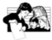
Apoyo de adulto