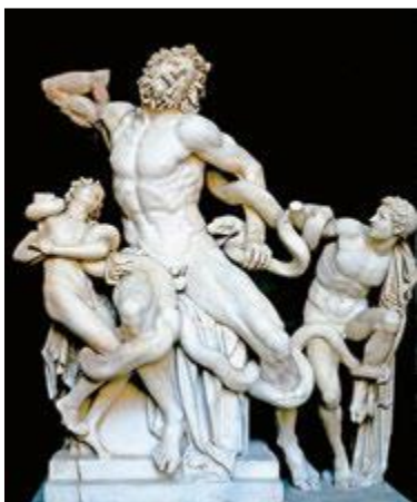
Laocoonte y sus hijos, escultura griega.

El arte ha sido parte fundamental de la vida del ser humano a lo largo de su historia. Esta forma de expresión se relaciona con la época en que se desarrolla y nos permite conocer parte del pasado. Los griegos nos dejaron una gran diversidad de obras como pinturas, esculturas, mosaicos, cerámicas y edificios . Los ideales de belleza y perfección del cuerpo humano del arte griego han influenciado a artistas de muchas épocas y muchas partes del mundo, incluso de Chile.