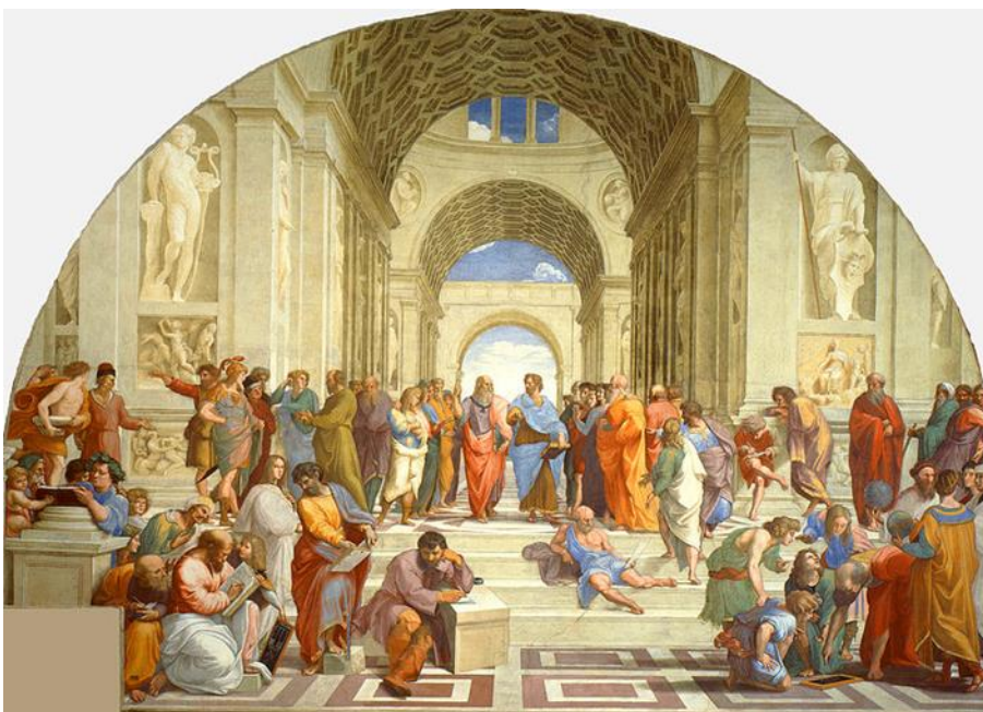
La escuela de Atenas, Raffaello Sanzio, (1509).

Para los antiguos griegos el ocio se asociaba con el descanso y el estudio.